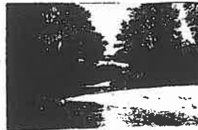
Site du "Barri"